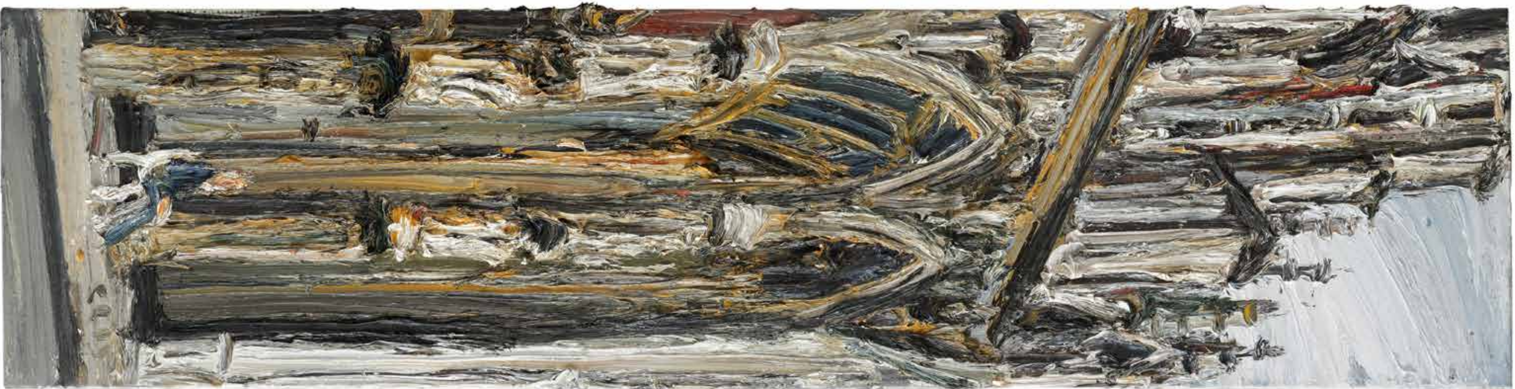
„Gotisches Portal“, Ulmer Münster, 2015, Öl/Leinwand, 200 x 50 cm