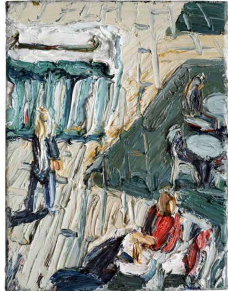
„Cafészene“, am Ulmer Münster 2015, Öl/Leinwand, 40 x 30 cm