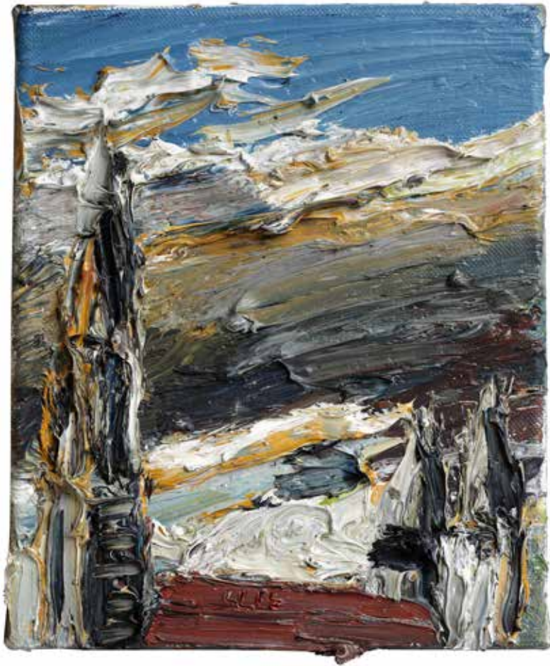
„Münster mit Abendhimmel“, Ulm 2015, Öl/Leinwand, 30 x 24 cm