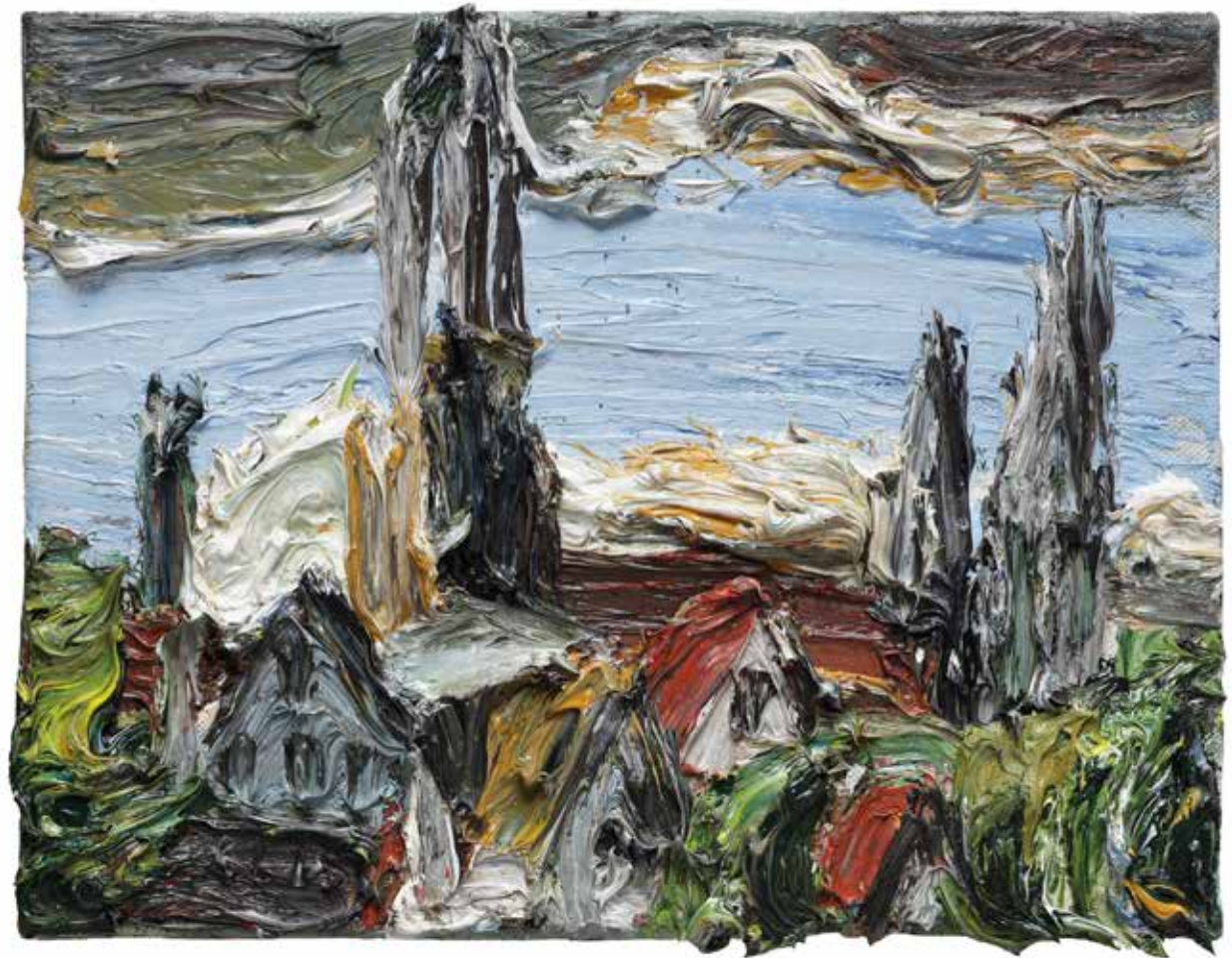
rechts: „Schlafende Häuser“, Ulm 2015, Öl/Leinwand, 30 x 40 cm