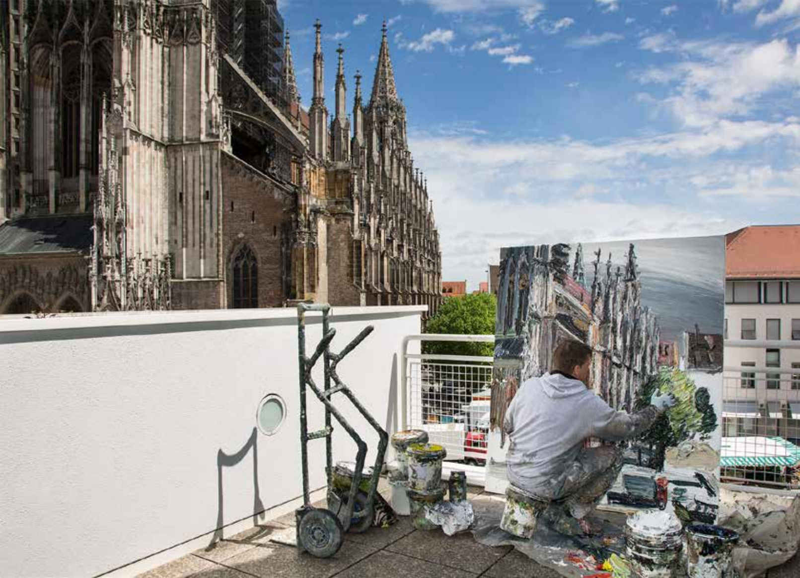
„Markt am Ulmer Münster“ 2015, Öl/Leinwand, 170 x 150 cm