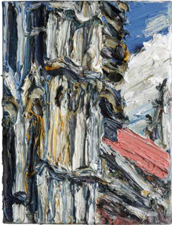
„Gotisches Fragment“, Ulmer Münster 2015, Öl/Leinwand, 40 x 30 cm