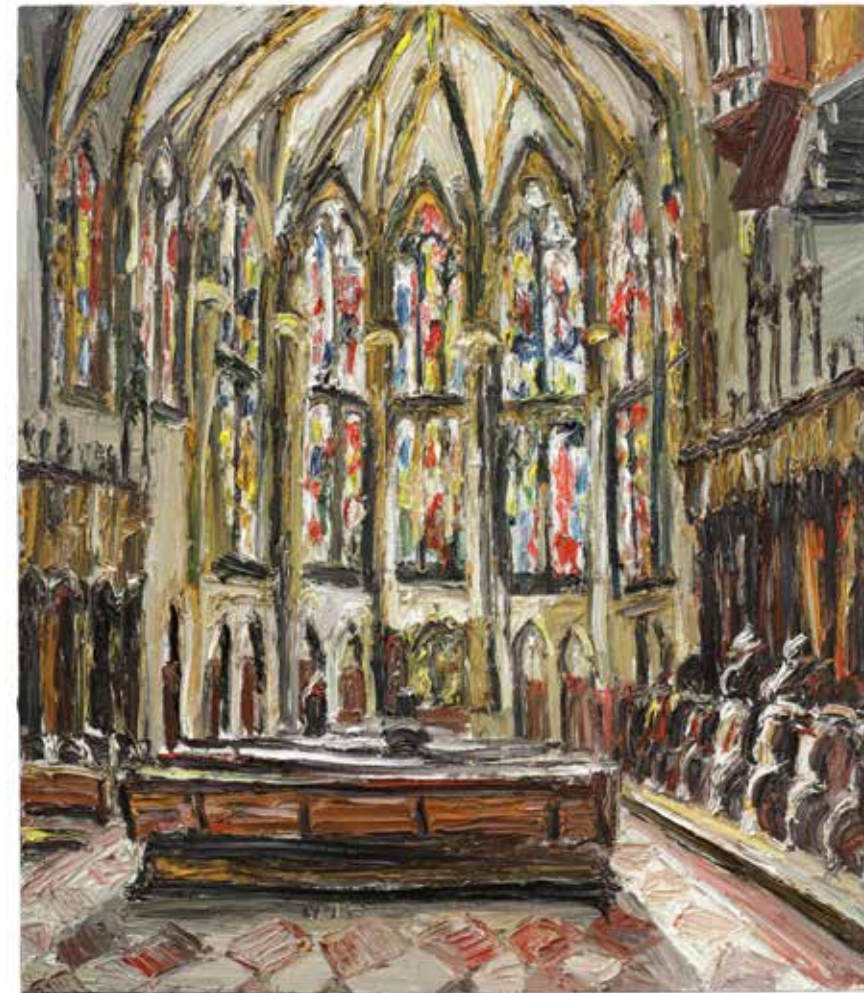
„Chor“, Ulmer Münster 2015, Öl/Leinwand, 140 x 120 cm