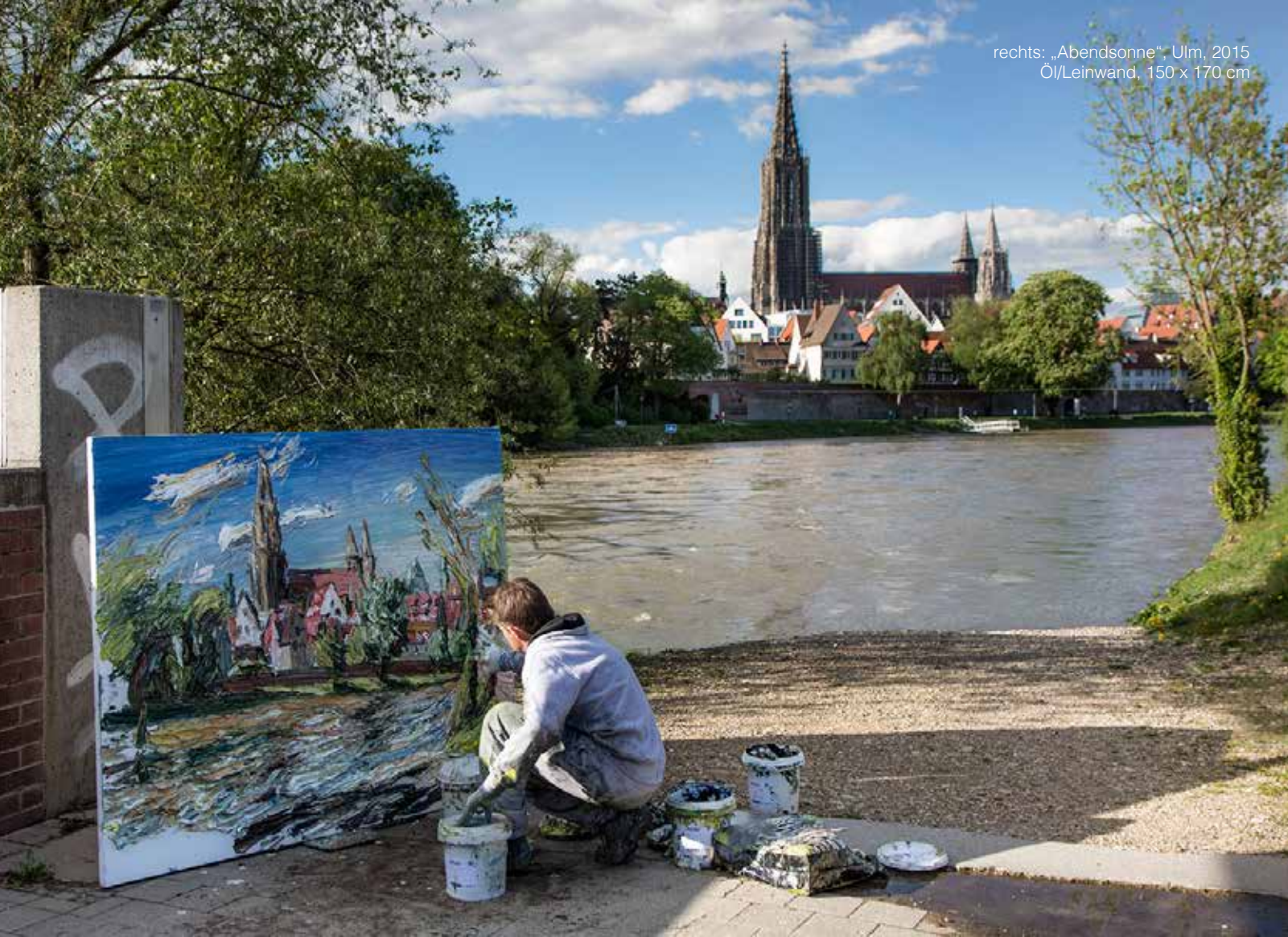
rechts: „Abendsonne“, Ulm, 2015 Öl/Leinwand, 150 x 170 cm